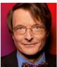
Prof. Dr. Karl Lauterbach